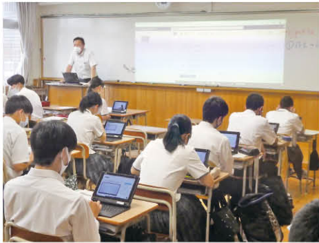
総合的な探究の時間

1年次から大学進学を念頭においた学習指導を組織的に行っています。1年次は全科目を共通に(一部の科目選択を除いて)学習し、基礎的・基本的な内容の定着を目指します。2年次からは、各自の進路希望に応じて文理別類型を選び、さらに幾つかの科目を選択して学習します。