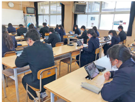
オンライン英会話

今年度からは1人1台端末が整備され、これらを使用した授業が本格的にスタートしました。端末の画面を見比べながら自分の意見を発表したり、議論したりするなど、自分たちの意見を共有し課題の解決をおこなっています。その他にも、英語の授業はペアワークが多く用いられており、英語を話す力や聞く力が養われるところが魅力です。