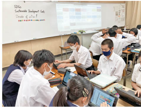
ホームルーム活動