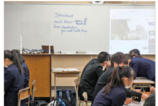
CLIL (内容言語統合型学習：数学)